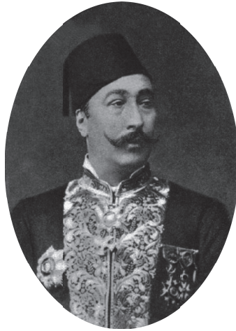
محمد سامي البارودي باشا.

كوكس قنصل إنجلترا في الإسكندرية أن يقنع عرابياً بإحالة «الطلبات» القومية إلى سدة الخلافة لينظر فيها «أمير المؤمنين» بما يستحسنه، وهو — بطبيعة الحال — لم يكن يستحسن في ذلك الحين إنشاء مجلس نواب في القاهرة يتبعه مجلس نواب في الآستانة، فأسرع عرابي إلى الموافقة على إحالة الأمر إلى سدة الخلافة، ولكنه أصر على عزل الوزارة؛ لأنه شأن من الشؤون المصرية. ثم استجاب الخديو آخر الأمر إلى عريضة الضباط وعريضة الأعيان التي رفعت بعدها بيوم واحد، فاستدعى «محمد شريف باشا» لتأليف وزارة دستورية، فاعتذر كثيراً واشترط لقبول تأليفها إقصاء زعماء الضباط إلى الأقاليم ولم ينزل عن هذا الشرط، فتوسط عليه القوم بينه وبين الضباط ووعده عرابي وأصحابه بالسفر من القاهرة إلى حيث تنقلهم الوزارة بعد إعلان الدعوة إلى انتخاب مجلس النواب.